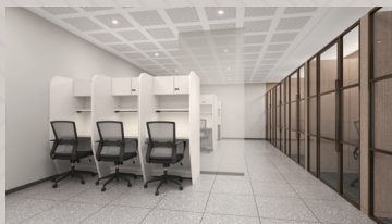
독서실 (남녀독서실, 1인독서실)