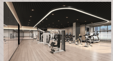
피트니스 클럽 (PT/GX/멀티스포츠클럽)