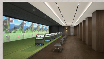
실내골프클럽 (전타석 GDR시스템)