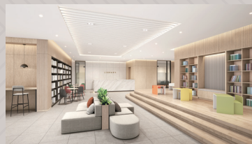
북카페 (키즈룸, 스테디룸)